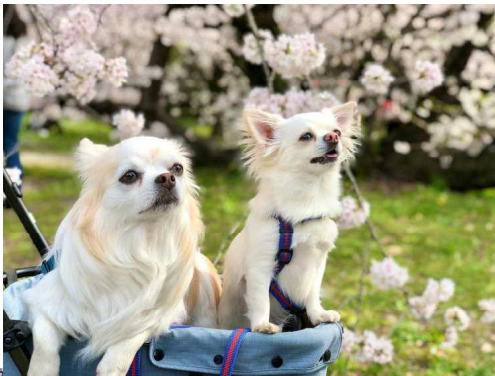
「ふくららとお花見 名古屋城と能楽堂」