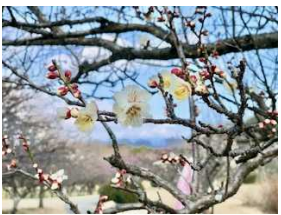
やっと、梅が咲き始めました・・・

寒い二月、ふくとたらは、毎日鶴舞公園の散歩を楽しんでいます。竜ヶ池が綺麗になりました。